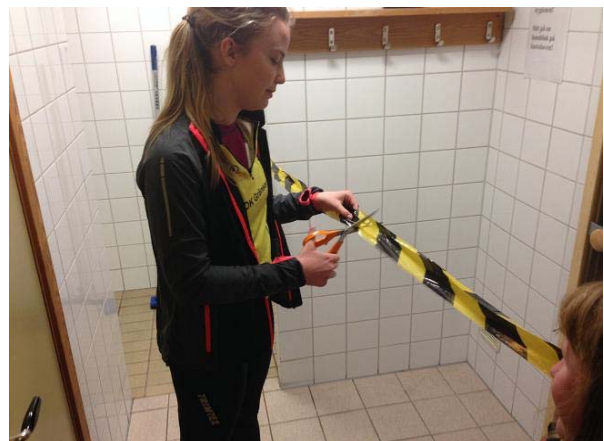
Invigning av dambastun

Spåren har krävt många mantimmar. Vi har bla röjt sly, förbättrat underlaget med flera billass grus samt satt upp nya markeringar i samtliga spår. Ett annat stort arbete är huggandet av all den ved som läggs upp intill vår stora utomhusgrill. Även vår maskinpark har krävt visst underhåll.